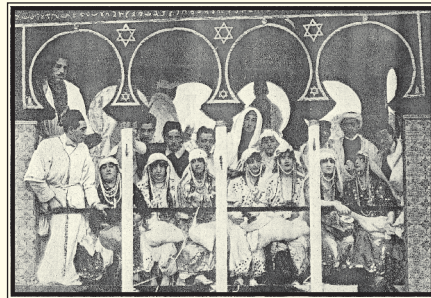
A la izquierda de estas líneas, las carrozas "Juego de bolos", "El dios Momo" y "Salón moro".